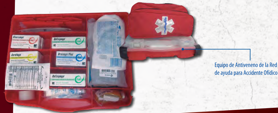
Equipo de Antiveneno de la Red de ayuda para Accidente Ofídico